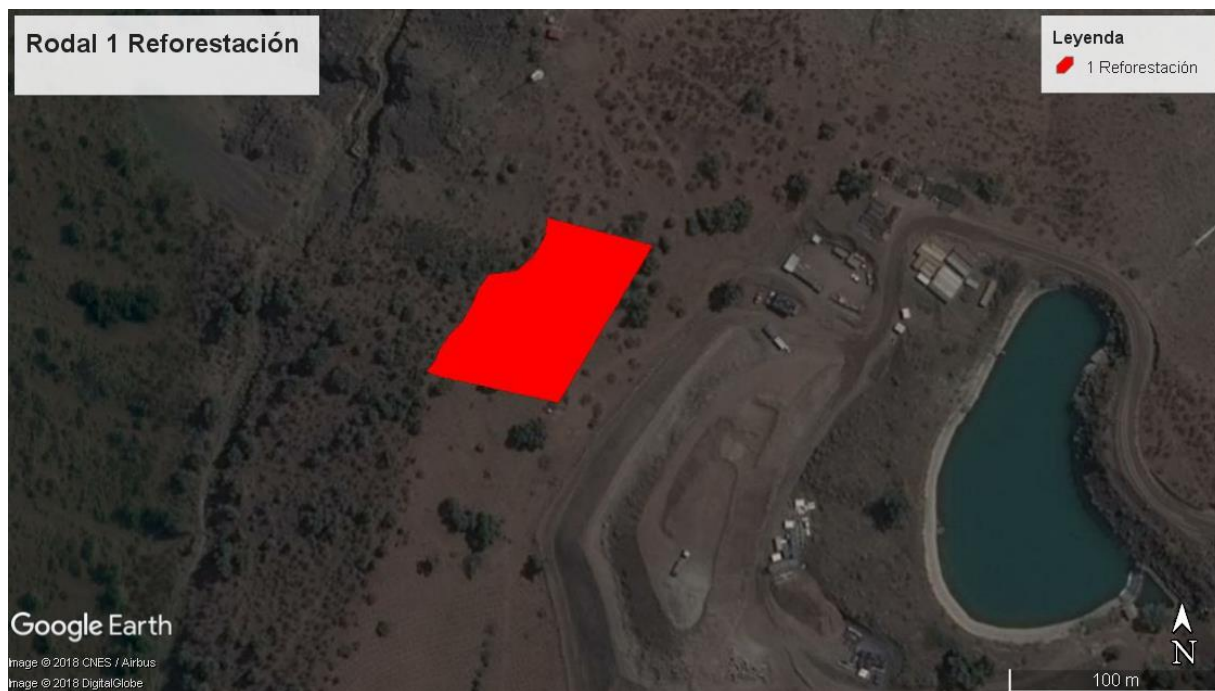
Figura N° 1: Imagen superficie rodal de plantación acción 8 (Rodal 1 Reforestación).