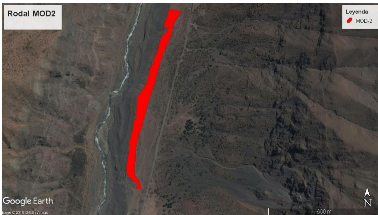
Figura N° 3: Imagen superficie rodal de plantación acciones 10, 11 y 14 (MOD-2).