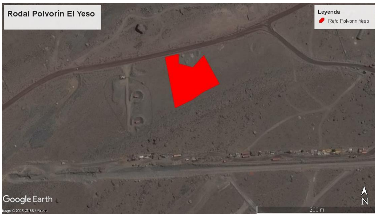
Figura N° 6: Imagen superficie rodal de plantación acción 15 (Rodal Polvorín El Yeso).