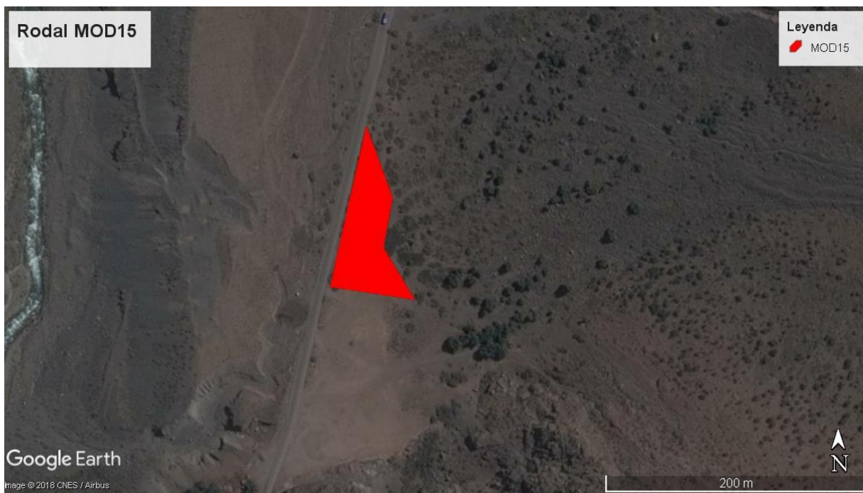
Figura N° 5: Imagen superficie rodal de plantación acción 13 (MOD-15).